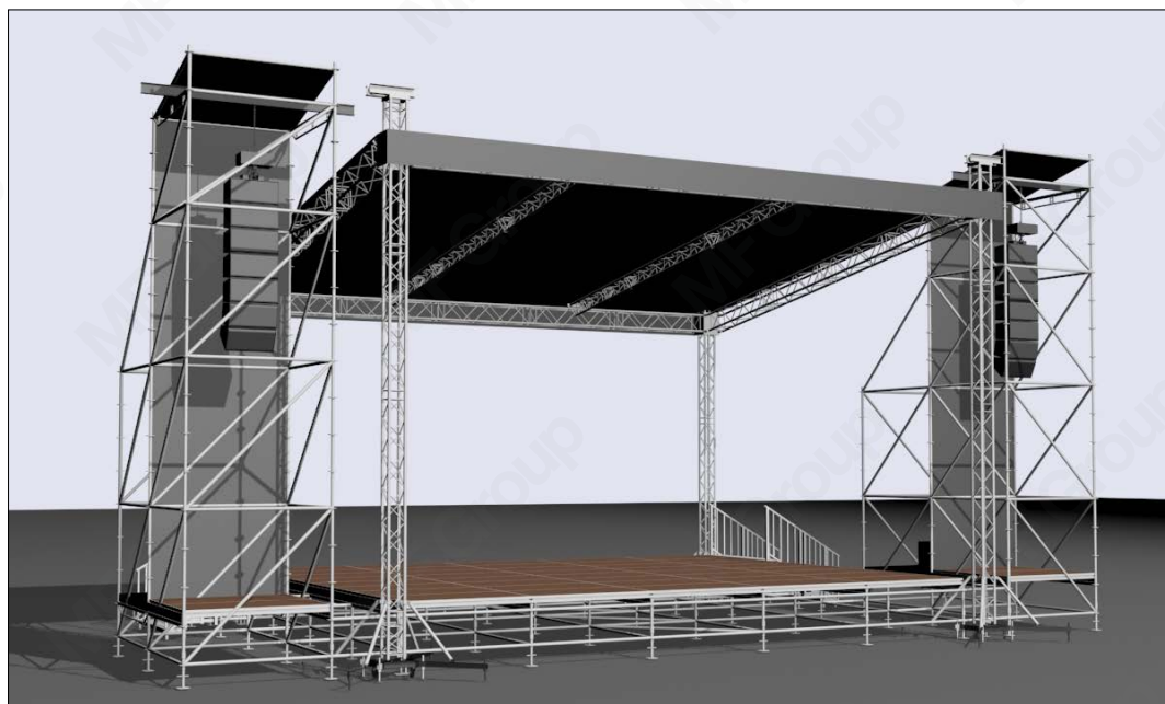
FLAT ROOF 10x8 м